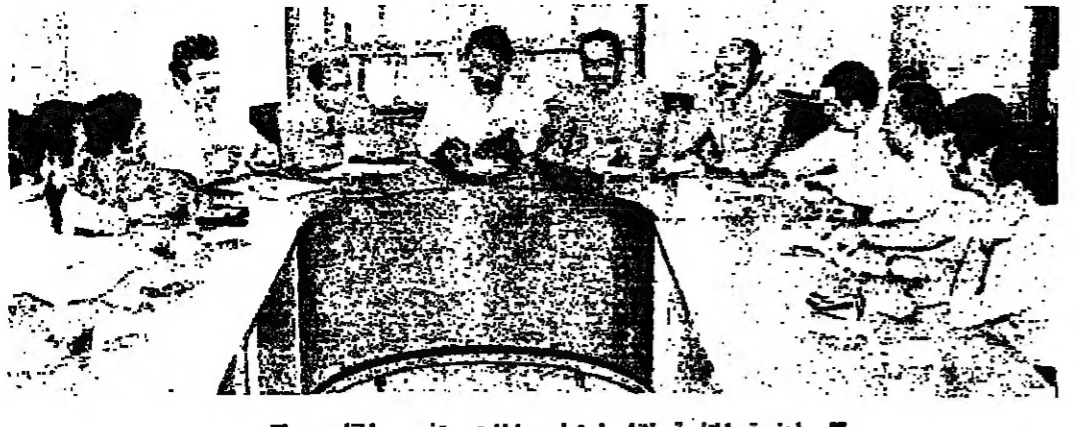
لجنة المثابرة أثناء اجتماعها بباردي مخرجي القاصد

وقررت اللجنة ان تعقد مؤتمرا صحفيا في النادي ، في مطلع الاسبوع المقبل ، لتبث في كيفية مجابهة الازمة مجابهة جديرة .